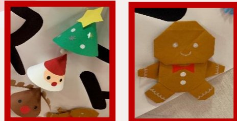
保育室のお子様が付用のクリスマスの飾りを作ってくれました♡