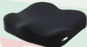
【アウル REHA 3D ジャスト】