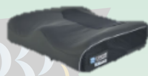
【エンプレスクッション】