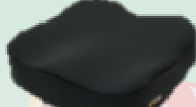
【アウル REHA3D ハイ】