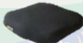
【アウルサポートシートクッション】