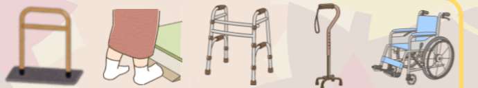
要支援 1・2 / 要介護 1