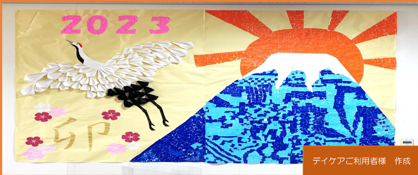
デイケアご利用者様 作成